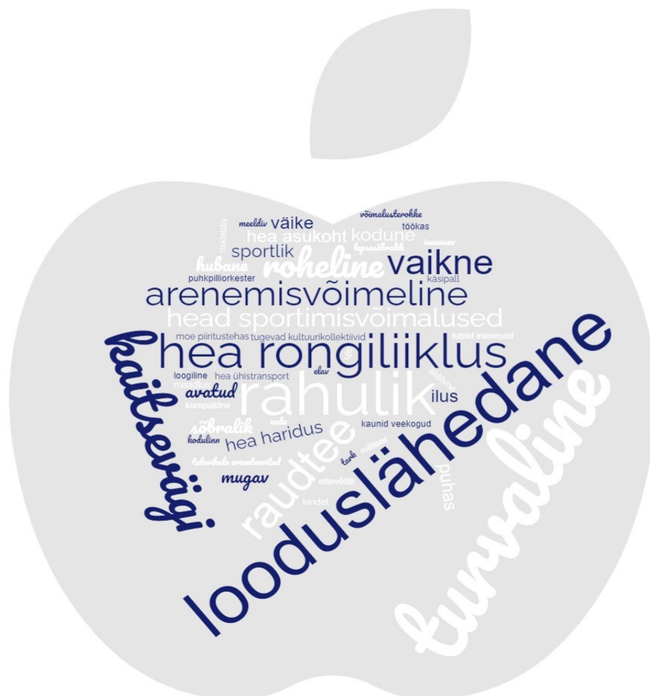
Joonis 1. Tapa vald täna märksõnades.